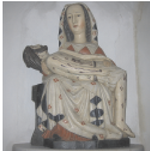
Pieta, Kopie eines Originals aus dem 13. Jahrhundert

Das Titelbild stammt aus dem Stadtarchiv Ingolstadt (Graphische Sammlung II / 1232)