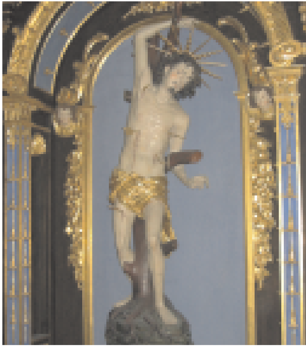
Hl. Sebastian, Hochaltar, 1634

Die Sebastianskirche in Ingolstadt wurde als sogenannte Bürgerkirche um 1500 fertiggestellt. Die Bürger der Stadt hatten dieses Kleinod der Altstadt finanziert und gebaut. Der Freundeskreis Sebastianskirche Ingolstadt greift diese Idee auf und wendet sich an alle, die an diesem besonderen Bauwerk interessiert sind.